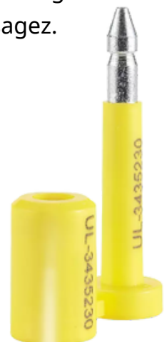
Un scellés de haute sécurité ISO 17712

Pour de plus amples renseignements sur vos obligations en matière de scellement, veuillez consulter les Lignes directrices pour le scellement du fret à l'intention des participants au programme PEP.