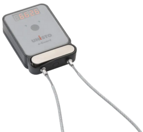
Exemple de scellé électronique interactif

L'ASFC appuie les dispositifs conformes à la norme ISO 17712 qui offrent un niveau de sécurité supérieur à celui des scellés décrits ici. Veuillez communiquer avec votre agent principal des négociants dignes de confiance pour discuter des mesures de sécurité supplémentaires que vous envisagez.